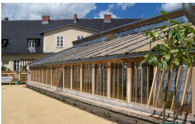
Das Ananashaus wurde 2012 auf der Grundlage von alten Zeichnungen nachgebaut. Heute befindet sich hier eine Ausstellung.