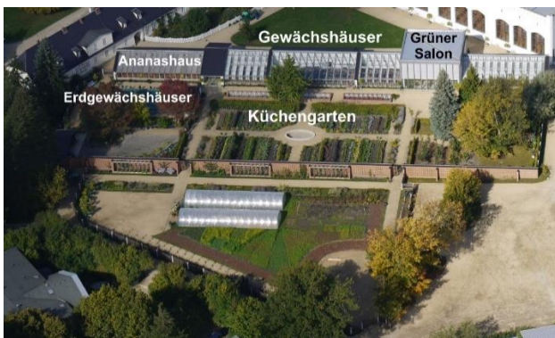
Überblick über die Schlossgärtnerei mit der Gewächshauszeile (oben) und dem dazugehörigen Küchengarten.

Nach dem Zweiten Weltkrieg wurde in der Schlossgärtnerei vor allem Obst und Gemüse angebaut, um die Ernährung der Einwohner Muskaus zu sichern. 1959 eröffnete in den Gewächshäusern dann ein Tropenhaus. Die exotischen Pflanzen faszinierten die Besucher, die damals nicht in ferne Länder reisen konnten.