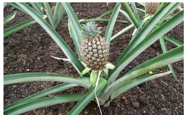
In einem der Gewächshäuser gibt es ein Hochbeet mit Ananaspflanzen. Es dauert drei Jahre, bis die Pflanze eine Frucht bildet.