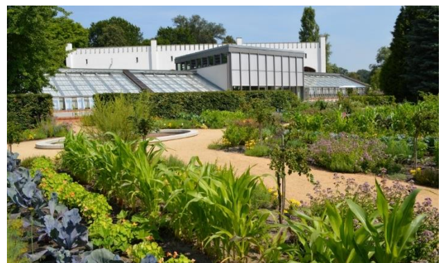
Blick aus dem Küchengarten auf die Gewächshäuser. Das höchste Haus ist der „Grüne Salon“. Dahinter steht die Orangerie.