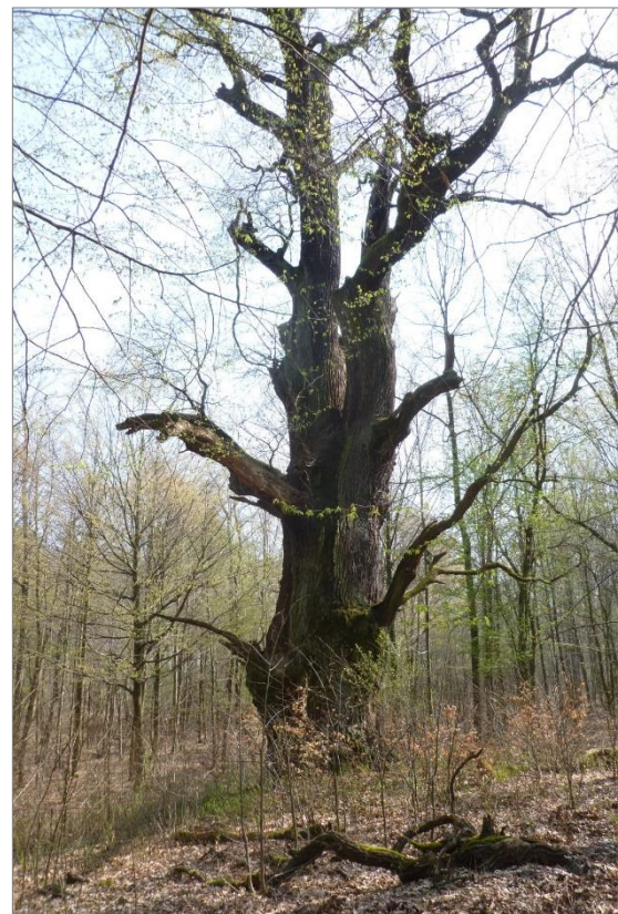
Abb. 5: Namenlose Uralteiche an der Kiebitzwiese im östlichen Parkteil (Foto der Autorin, 2019).