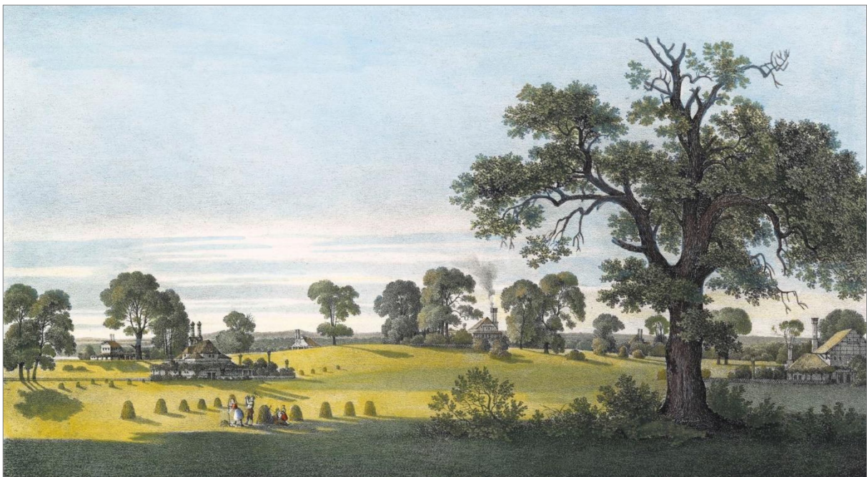
Abb. 2: Pücklers Entwurf für die Gartenarbeitersiedlung „Colonie Gobelin“ im östlichen Parkteil, 1834 (kolorierte Lithographie, Abbildungstafel 39 in Pücklers „Andeutungen über Landschaftsgärtnerei“, Original: Stiftung „Fürst-Pückler-Park Bad Muskau“).

Schon in frühester Zeit besaßen freistehende Bäume für die Menschen eine besondere Bedeutung. Sie wurden zu Geburten und paarweise zu Hochzeiten gepflanzt, dienten der Orientierung, als gesellschaftlicher Treffpunkt, Tanz- oder Gerichtsbäume. Die Sitte, besondere Exemplare mit Namen zu belegen, lag damit auf der Hand.