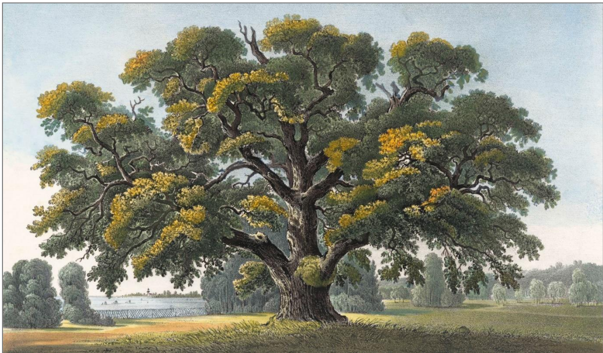
Abb. 3: Uralteiche im Tiergarten bei Weißwasser, 1834 (kolorierte Lithographie, Abbildungstafel 42 in Pücklers „Andeutungen über Landschaftsgärtnerei“, Original: Stiftung „Fürst-Pückler-Park Bad Muskau“).

Wann die ersten Bezeichnungen der Muskauer Uralteichen entstanden, lässt sich leider nicht genau belegen. Vermutlich wurde bereits vor Pücklers Wirken mit den Namensgebungen begonnen, die der Fürst später aufgriff und fortführte. Er selbst schreibt bedauerlicherweise nur sehr allgemein über die in seinem Besitz vorhandenen, majestätischen Uralteichen, ohne dabei Namen zu nennen. In seinen „Andeutungen“ rühmt er beispielsweise den Blick vom Aussichtshügel im Blauen Blumengarten: „man gewahrt [...] [eine] Hügelkette, die mit einem weiten Walde bedeckt ist, aus dem als Hauptpunkte einige uralte Rieseneichen auf den höchsten Spitzen der Berge einzeln hervorragen.“ Bei der Beschreibung seiner dritten Spazierfahrt erwähnt er außerdem seine geplante Gartenarbeitersiedlung „Colonie Gobelin“, die „auf einer Höhe zerstreut [ist], die durch alte Eichen hervorgehoben wird, welche schon viele Jahrhunderte zählen mögen. Unter einer derselben fand man vor wenigen Jahren einen kleinen Schatz, wahrscheinlich in der Zeit des dreissigjährigen Krieges vergraben, von dem ich noch mehrere Münzen aufbewahre.“ Über weitere Details hüllt sich der Fürst jedoch in Schweigen, selbst die Hermanns-Eiche bleibt in den „Andeutungen“ ungenannt. Immerhin sind auf den Abbildungstafeln mehrfach sehr alte Eichen zu sehen (Abb. 2); einem besonders stattlichen Exemplar, das er in seinem Jagdpark vorgefunden hatte, widmete der Fürst sogar eine separate Darstellung (Abb. 3).