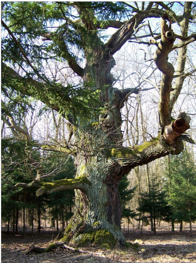
Abb. 1: Uralteiche im östlichen Parkteil, zur Gruppe der Odins-Eichen gehörig.

Einen besonderen Reiz des heutigen Muskauer Parks machen neben dem märchenhaften Schloss, den fantasievollen Blumengärten, den monumentalen Wiesen und den fesselnden Sichtachsen vor allem auch die vielen Ehrfurcht erregenden Altbäume aus. Während Pücklers Pflanzungen innerhalb von zwei Jahrhunderten bereits zu überaus beeindruckenden Baumpersönlichkeiten herangewachsen sind, wird deren Alter und Umfang von den Uralteichen mit Leichtigkeit überboten. Einzelne Exemplare begegnen dem Spaziergänger bereits in Schlossnähe, noch weitaus betagtere Bäume lassen sich erst bei einem ausgedehnten Spaziergang mit gutem Schuhwerk entdecken. Doch die Mühe lohnt sich – wer sich in die Tiefen des östlichen Parkteils wagt, wird mit naturgewaltigen Eindrücken belohnt, die sich fest im Gedächtnis verankern (Abb. 1).