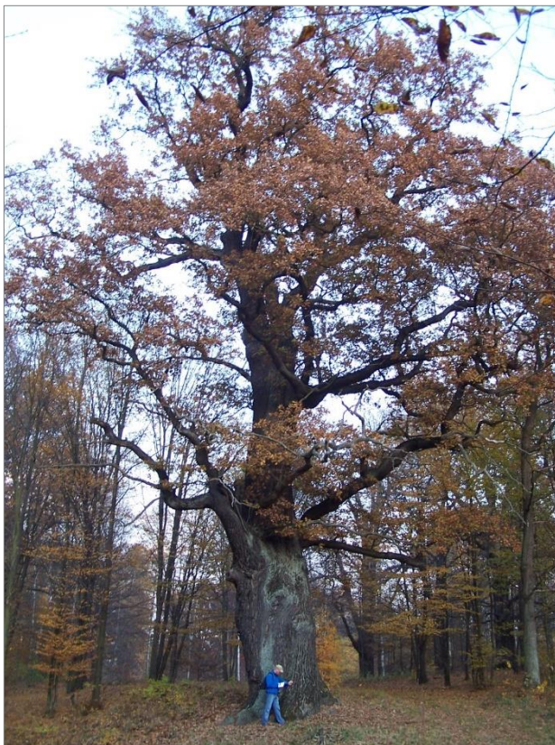
Abb. 4: Thor-Eiche unweit des „Englischen Hauses“ (Foto der Autorin, 2011).